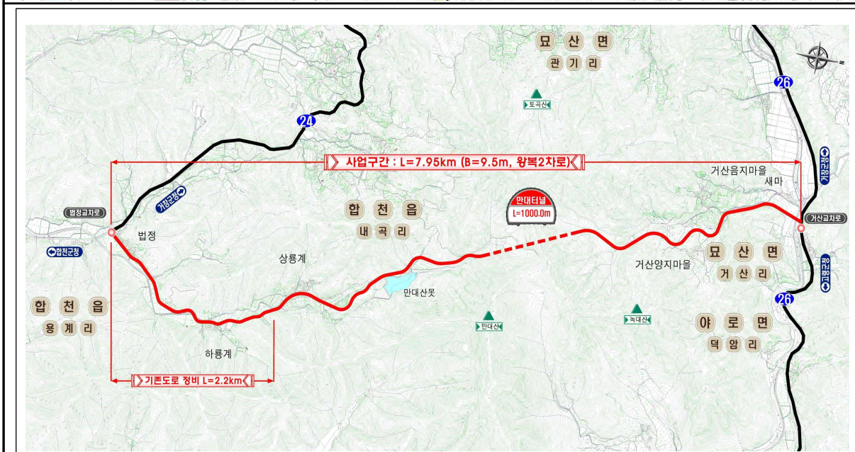
< 계획평면도 >