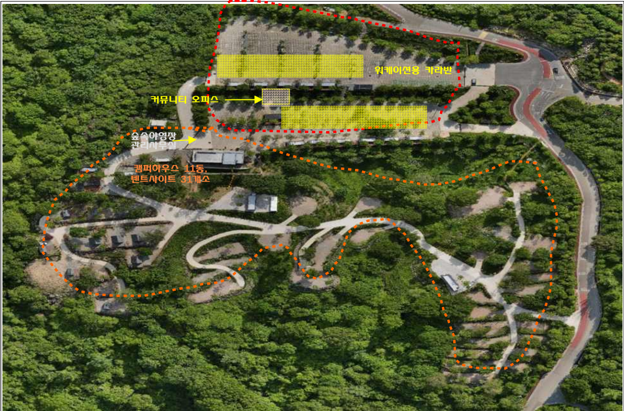
위치도(합천군 가회면 둔내리 산219-26번지 일원)