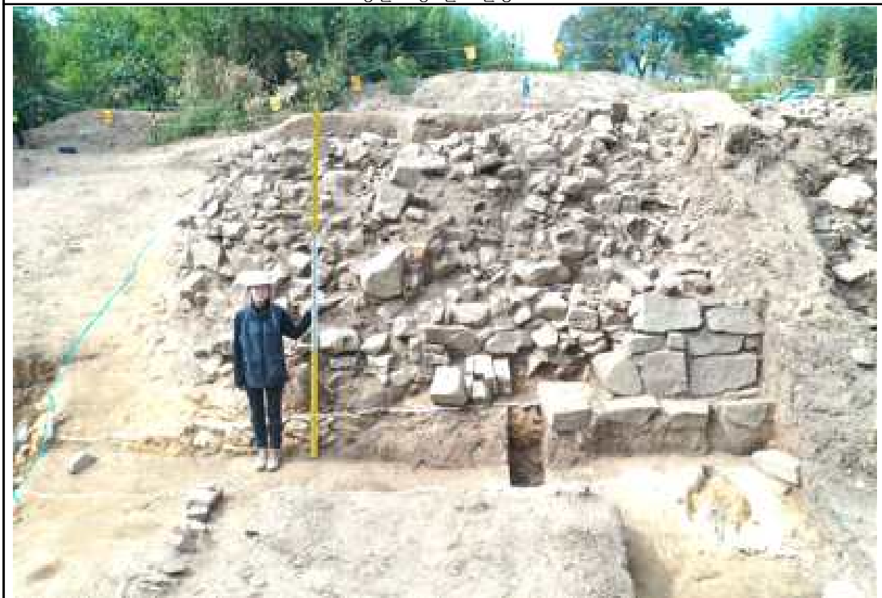
6차조사 외벽석 전경