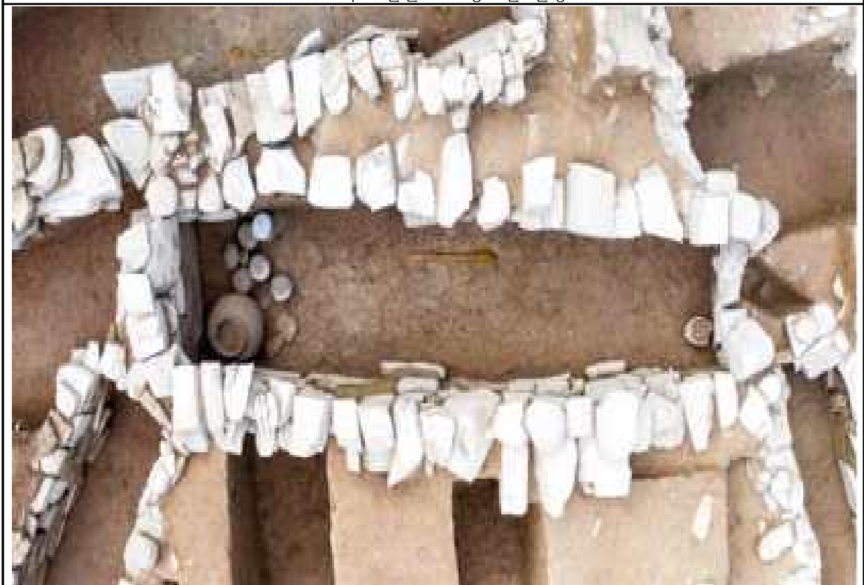
소오리 고분군 1호 봉토분 4호 돌덧널무덤 전경