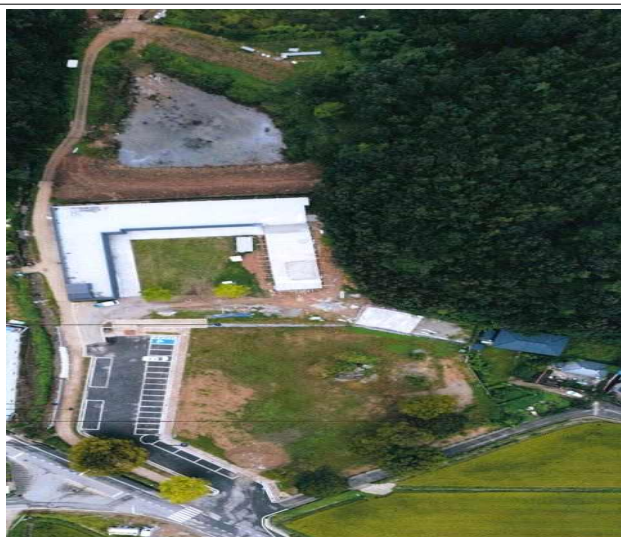
현재 사업 추진 현황도