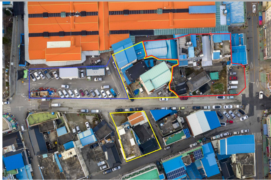
사진설명 : 기존주차장(파란선), A구역(빨간선), B구역(노란선)