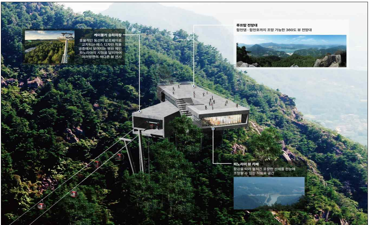
설 명 상부승강장 (전망대 및 악견산성 탐방로)