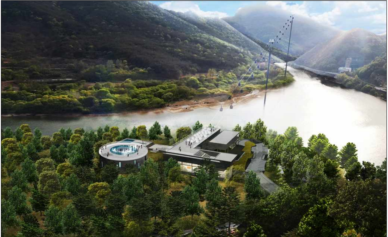
설 명 하부승강장 (워터스케이프타워 및 복합체험 공간)