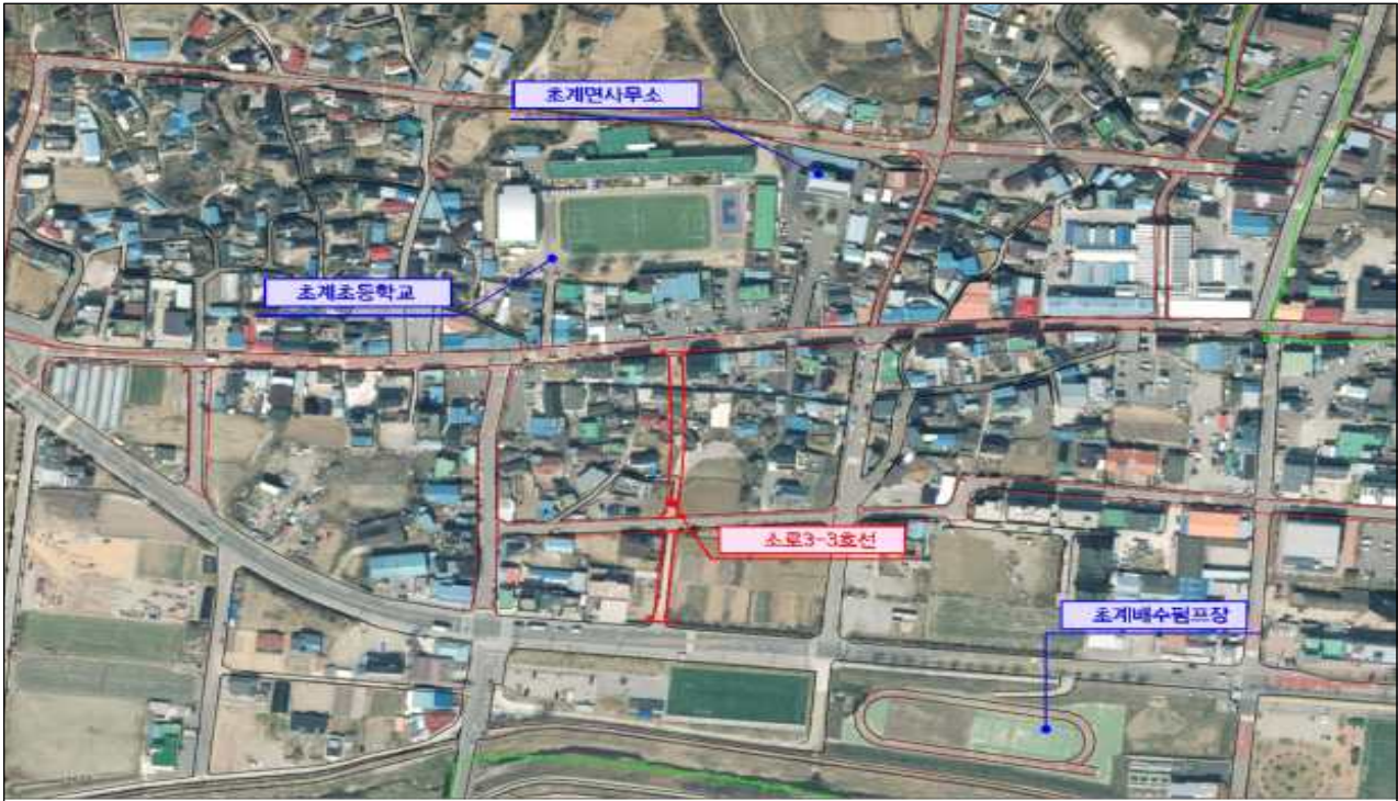
초계지구 도시계획도로 개설 위치도