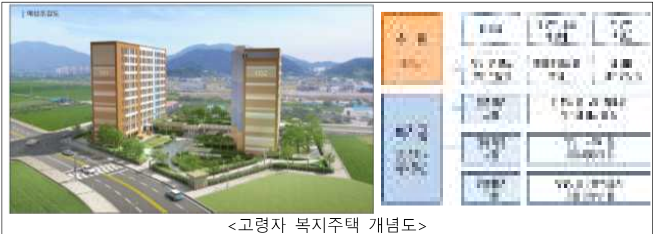
<고령자 복지주택 개념도>