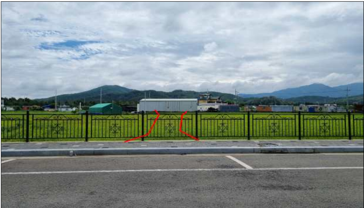
햇들(소2-167호선) 도시계획도로개설 현황사진