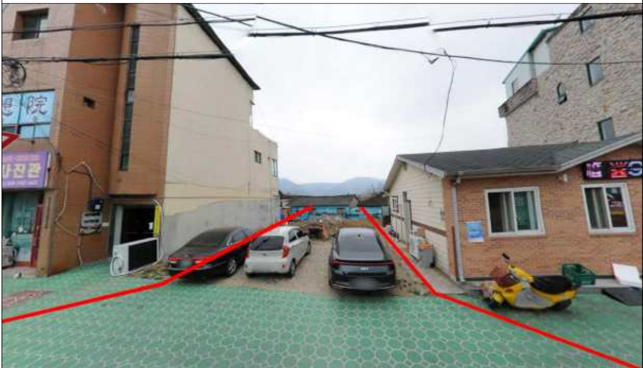
초계(소3-3호선) 도시계획도로개설 현황사진