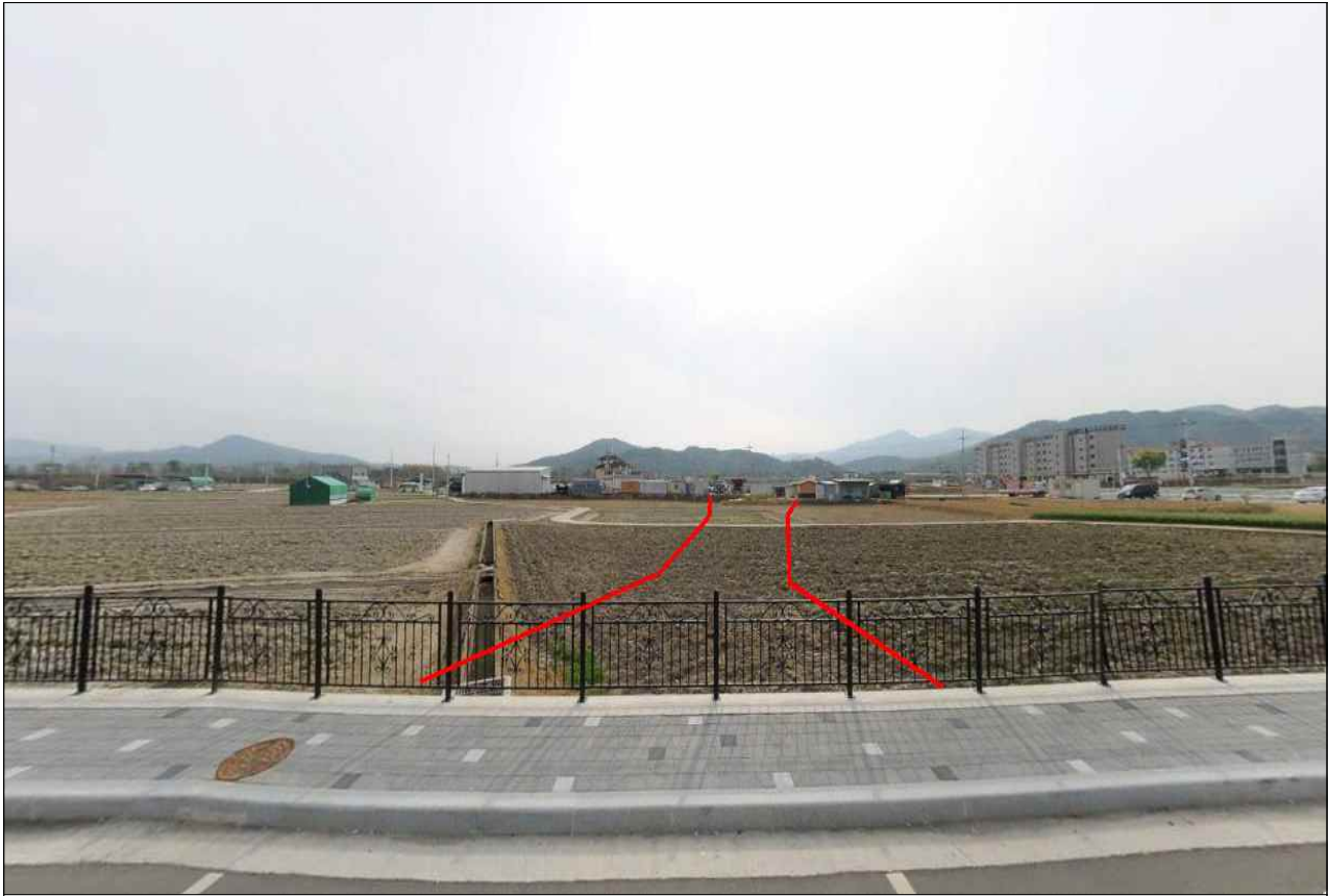
햇들(소2-168호선) 도시계획도로개설 현황사진