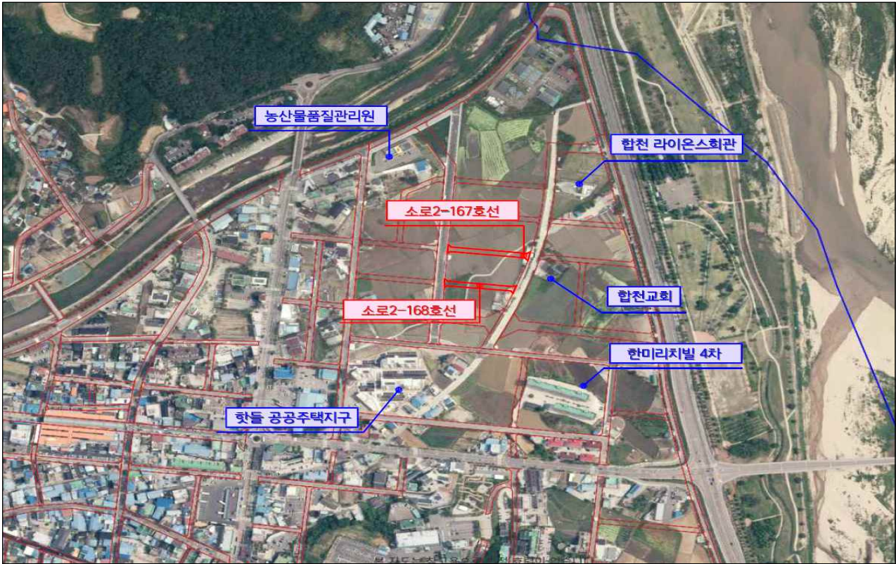
햇들지구 도시계획도로 개설 위치도