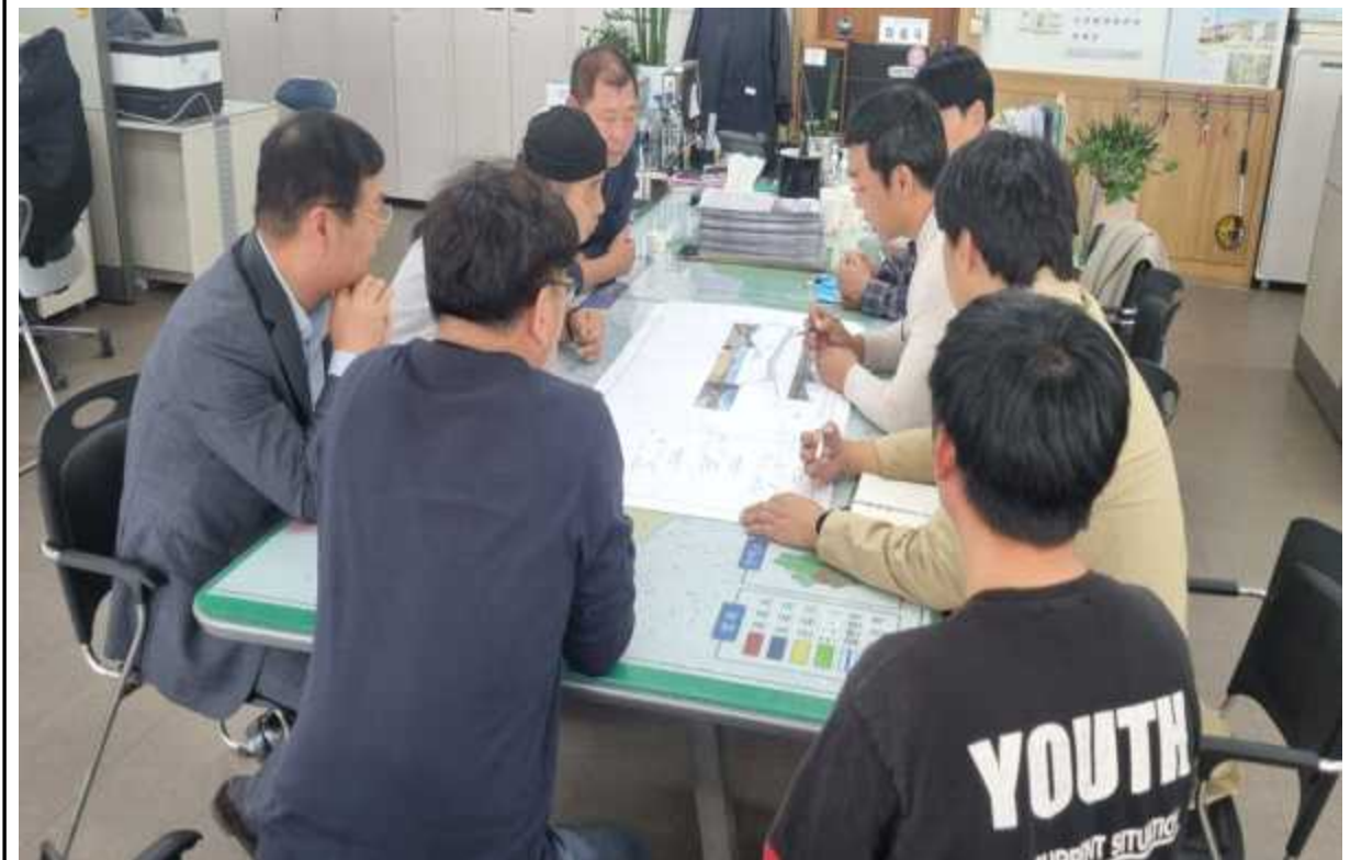
실시설계(안)에 대한 주민협의(2023.10.19.)