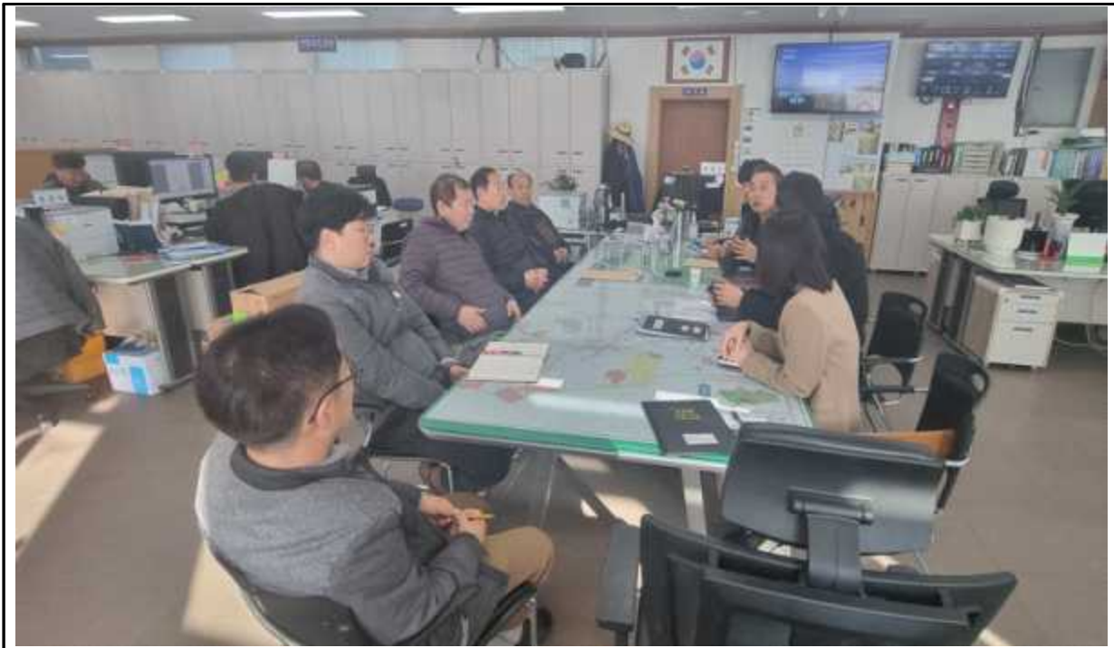
실시설계용역 착수 안내 및 사업계획 주민협의(2023.02.21.)