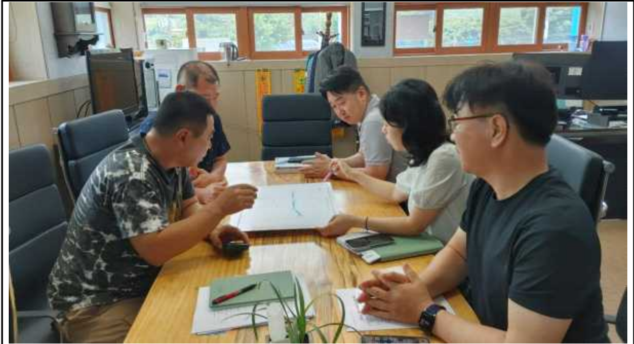
실시설계용역(안)에 대한 사전 보상협의(2024.07.12.)