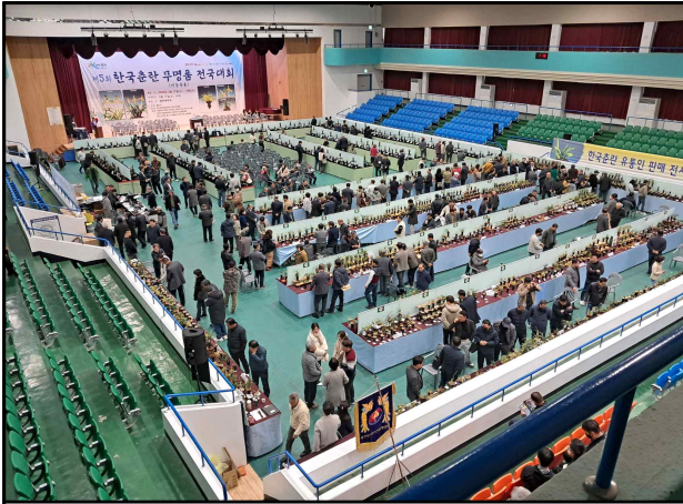
제5회 한국춘란 무명품 전국대회