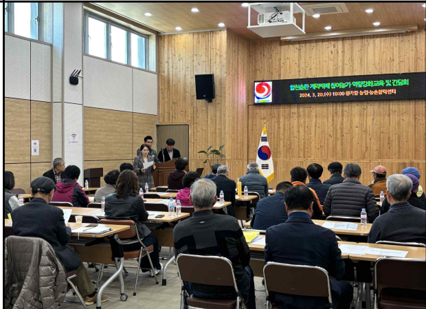
참여농가 교육 및 사업설명회