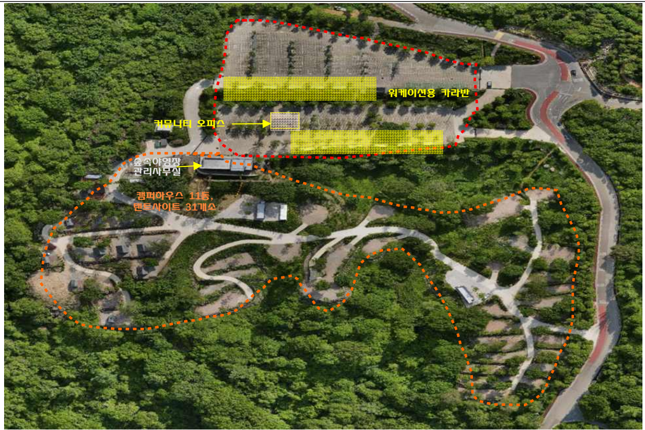
위치도(합천군 가회면 둔내리 산219-26번지 일원)