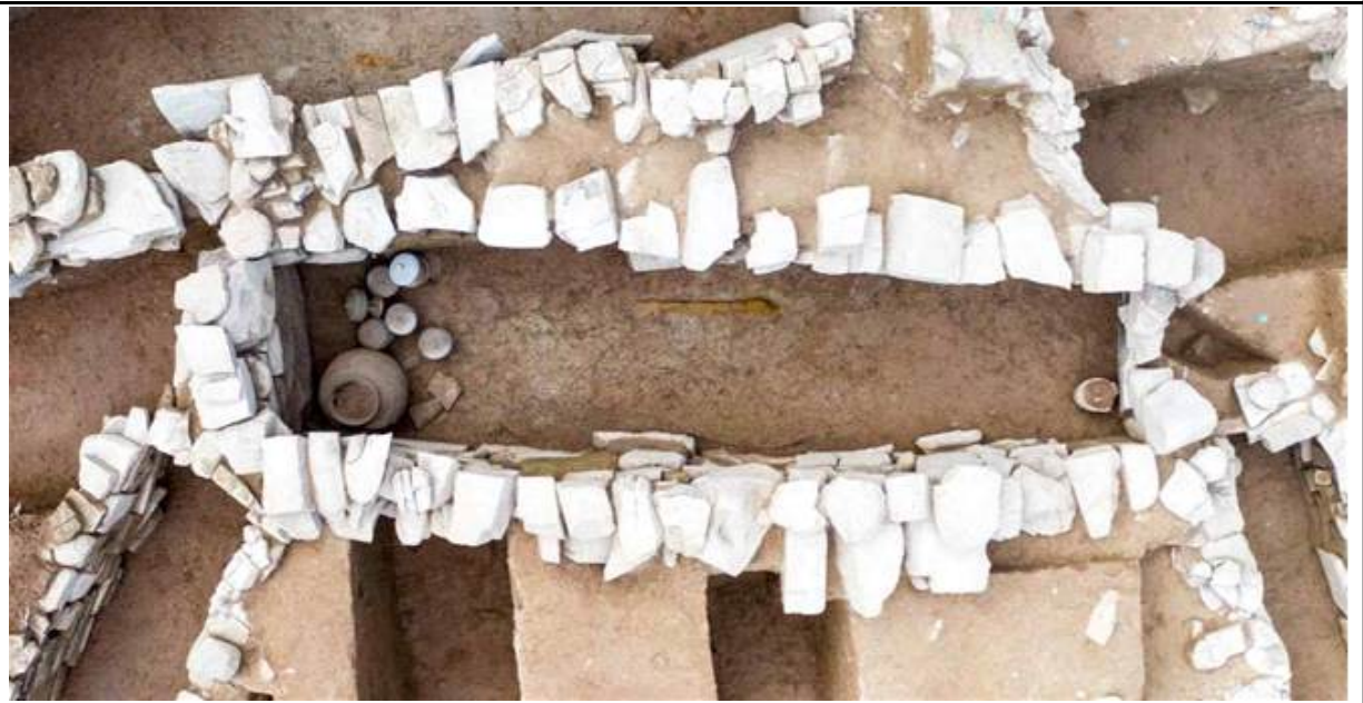
소오리 고분군 1호 봉토분 4호 돌덧널무덤 전경