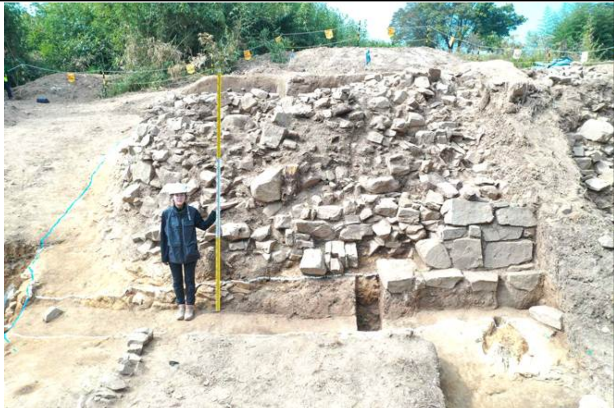
6차조사 외벽석 전경