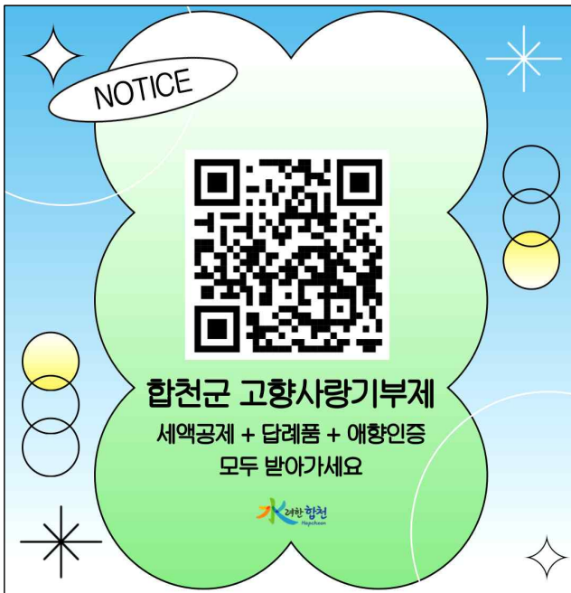
디자인 시안 1