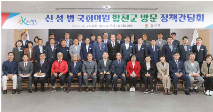
국회의원 초청 정책간담회