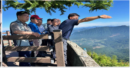
회장단 양수발전소 현장 방문