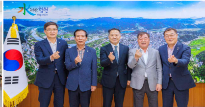
경남서부 4개군 행정협의회의