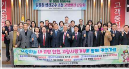
출향인 기업 방문 간담회