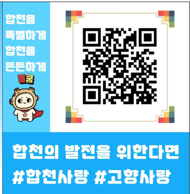
디자인 시안 2