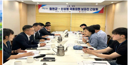
국회의원 보좌진 간담회