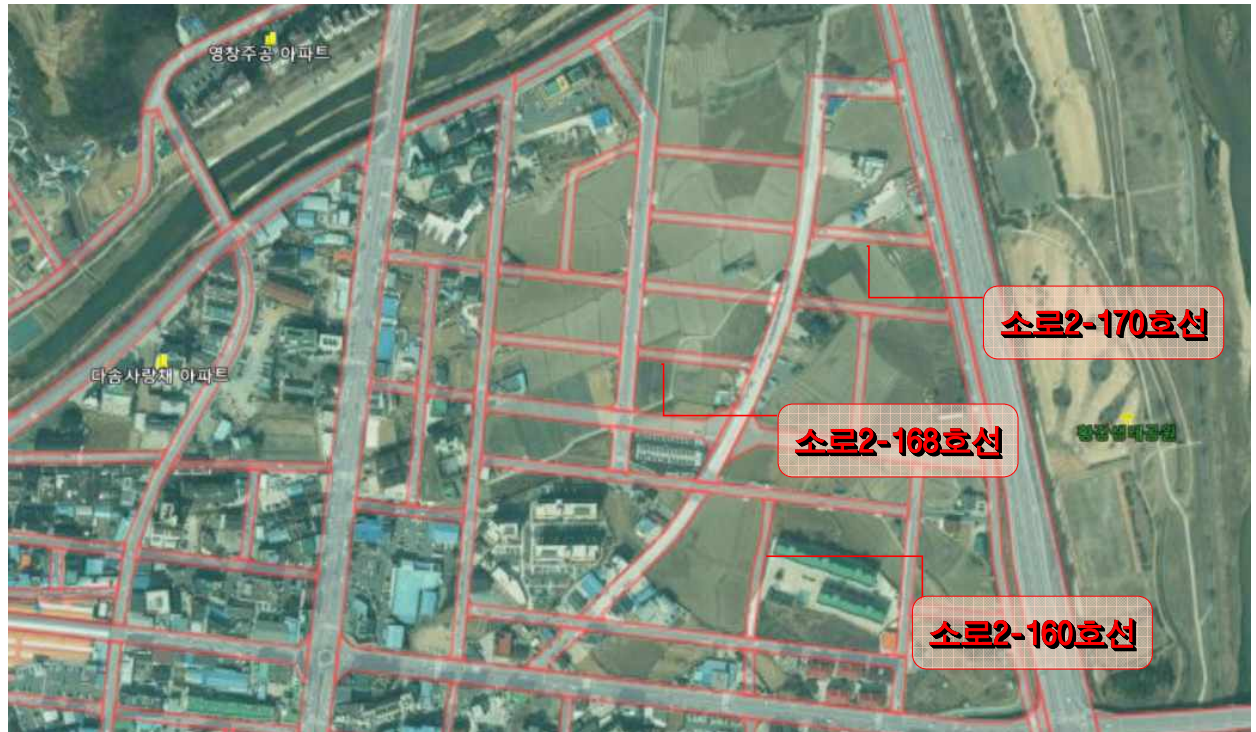
햇들 도시계획도로 개설 위치도