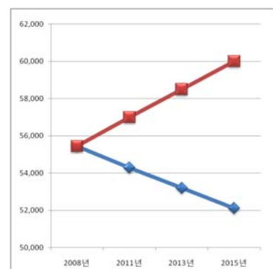
&lt;그림Ⅲ-3&gt; 목표인구 설정